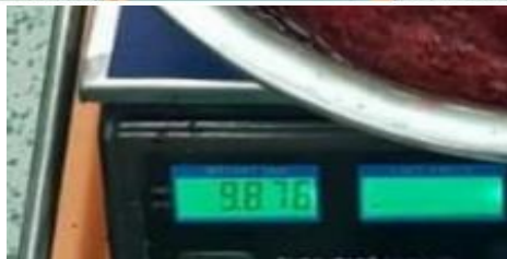
شکل ۳. وزن کبد خارج شده