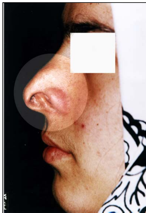
شکل ۳. تصویر نیم رخ بیمار قبل از عمل