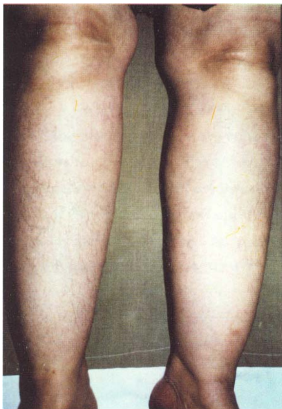
شکل ۲. میگسدم پره تیبیال در خانم ۵۸ ساله مبتلا به تیروتوکسیکوز

حدود بیمار می‌باشد، در اینجا نیز ۴ مورد گواتر بزرگ، ۲ مورد تیروئید قابل لمس، سه مورد تیروئید غیر قابل لمس و یک مورد گواتر زیر جناغ وجود داشته است. سه مورد از بیماران حاضر با شکایت اصلی خارش مراجعه کرده بودند که علیرغم بررسی‌های مختلف بیماری زمینه‌ای دیگری نداشتند. خارش مقاوم به درمان که گاهی تنها علامت بیماری می‌باشد در تیروتوکسیکوز گزارش شده است (۵). در بررسی Davis و Williams وجود این علامت ذکر نشده است (۴ و ۱۰). در بررسی حاضر ۳ مورد از بیماران دچار استفراغ طولانی همراه با بی‌اشتهایی و کاهش وزن بودند. اگرچه در بعضی منابع همراهی استفراغ با تیروتوکسیکوز ذکر گردیده است (۸ و ۱۱) اما در