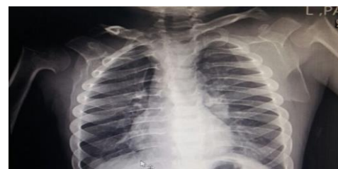
شکل ۳. گرافی های دست، کمر، لگن و قفسه سینه