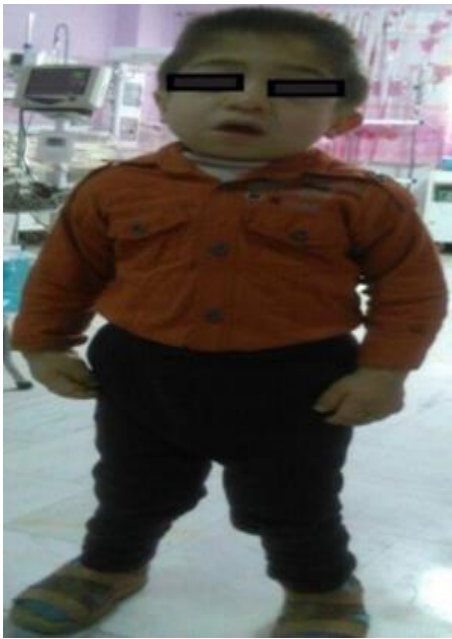
شکل ۱. ظاهر فیزیکی کودک مبتلا به MPS-VI