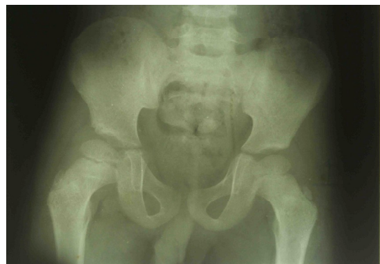
شکل شماره ۳. رادیوگرافی در پیگیری دو ساله بیمار