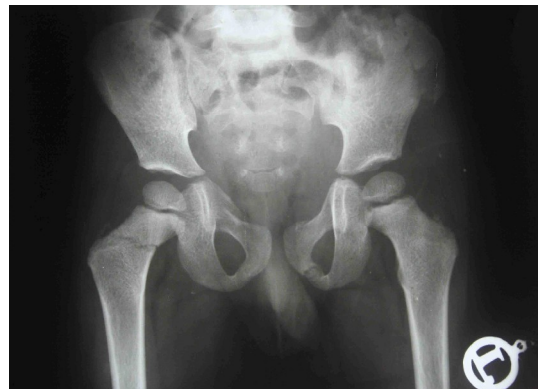
شکل شماره ۱. رادیوگرافی لگن بیمار در موقع ورود به اورژانس

تخلیه شد که هم تاییدی بر وجود شکستگی باشد و هم از نظر تئوری فشار وارد بر سر فمور کاهش یابد. پس از عمل گچ اسپایکای دوطرفه گرفته شد (شکل شماره ۲). بیمار هر دو هفته یکبار ویزیت و نهایتاً هشت هفته بعد پین ها خارج شد. در پیگیری دو سال پس از عمل جراحی بیمار بدون لنگش راه می رفت و والدین نیز مشکلی را ذکر نمی کردند. در معاینه هیچ گونه اختلاف طول دو اندام وجود نداشت. رادیوگرافی در این زمان هیچ نشانه ای از نکروز آواسکولار سر فمور نداشت و حتی اسکار شکستگی ها نیز دیده نمی شدند (شکل شماره ۳).