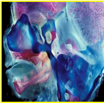
شکل ۶. استخوان فک جنین