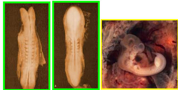
شکل ۴. رویان پیش سومیتی (مضغه)

ترشحات پرده آمنیون همه اینها دقیقا توسط پروردگار عالم برنامه ریزی شده است چرا که افزایش یا کاهش این مایع موجب عوارض مادری و جنینی خواهد شد (۲۱). بعد از این مرحله جنین به تکه گوشتی جویده شده شبیه می گردد (سوره مومنون) اگر با میکروسکوپ به رویان پیش سومیتی در سنین (تقریباً ۲۰-۱۹ روزه) نگاه کنیم می بینیم که جنین در اثر برداشته شدن آمنیون، صفحه عصبی اش به وضوح دیده شده سومیتها و ناودان عصبی تشکیل شده و چینهای عصبی دیده می شوند که همانند تکه گوشتی جویده شده است (شکل ۴) (۷ و ۸).