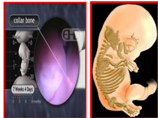
شکل ۵. نمای سونوگرافی استخوان ترقوه

در این مرحله دستگاههای مهمی مثل سیستم عصبی قلب و مغز شروع به ساخته شدن می کند و بعضی از آثار حسی ظاهر می شود، قلب شروع به ضربان زدن می کند، دستگاههای زیادی مثل دستگاه تنفسی و کلیه و کبد سریع شروع به رشد کردن می کنند (اورگانوژنز) در هفته ششم تا هشتم استخوان بندی شکل می گیرد و رشد آن تا بعد از تولد ادامه دارد. اگر با دستگاه سونوگرافی نگاه کنیم استخوان ترقوه جنین مشخص است (شکل ۵)، (۹-۷).