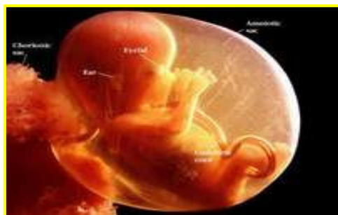
شکل ۳: کیسه جنینی

کیسه جنینی: در سوره زمر می خوانیم: خداوند شما را در شکم مادر می آفریند، آفرینش به دنبال آفرینشی دیگر در ۳ تاریکی (۱۹). اگر با میکروسکوپ به دقت نگاه کنیم همانطور که در آیه قرآن ذکر شده دور جنین ۲ پرده (آمنیون و کوریون) قرار دارد و مایعی بین این دو پرده، که آن را به ۳ فضا یا به قول قرآن ۳ تاریکی تبدیل کرده که در مجموع از جنین محافظت می کند. کیسه دور جنین او را تغذیه می کند غذا و هوا و نوشیدنی او را تأمین می کند موادی که باعث اذیت جنین باشد راه نفوذ به آن را نمی دهد و هورمونهایی را از خود خارج می سازد که باعث تنظیم درجه حرارت جنین می شود و دانشمندان می گویند همانا این کیسه از نوزاد نگهداری می کند به طوری که چندین برابر بهتر از اتاق مخصوص نگهداری نوزادان می باشد (۲۰ و ۱۹ و ۹ و ۸) (شکل ۳).